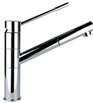
Miscelatore Lorenzo 8466 000