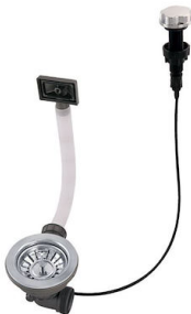
Piletta automatica 8407 100