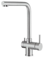
Miscelatore Gamma 3 vie - satinato 8496 100